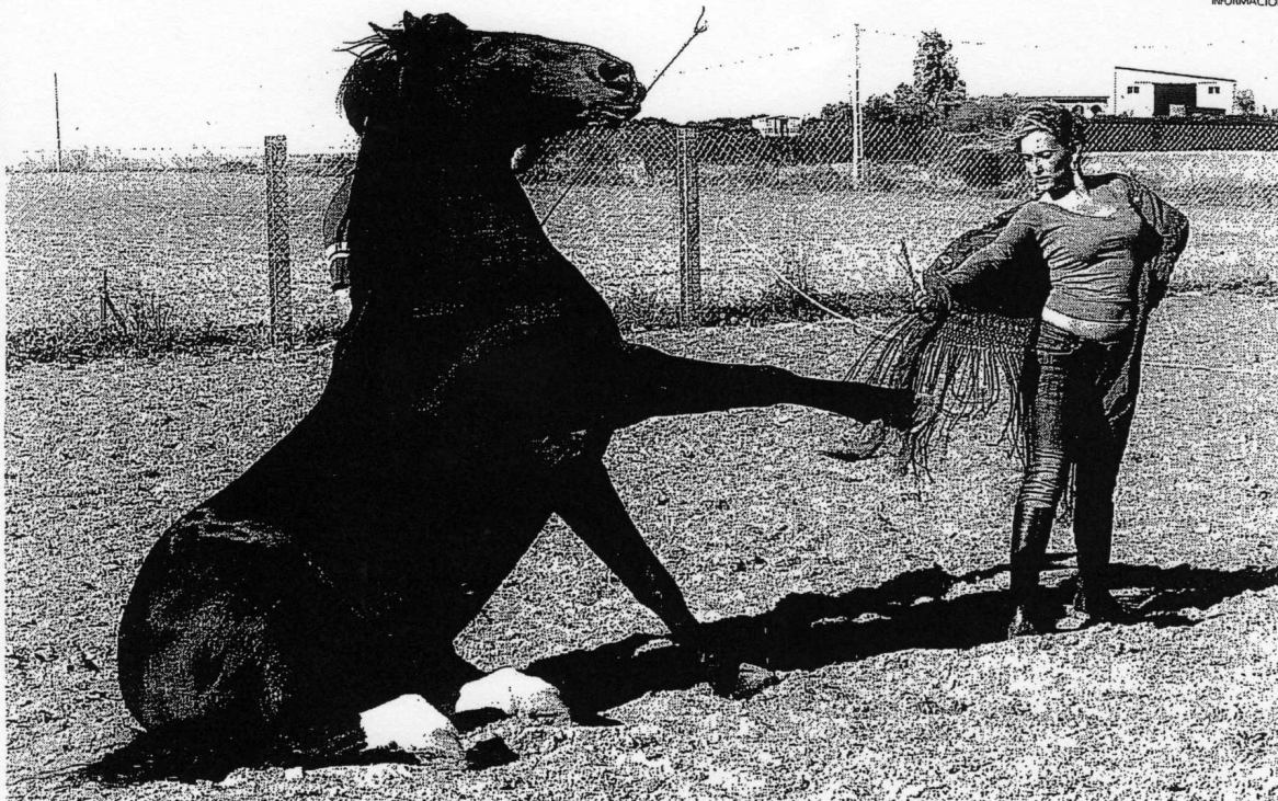
El espectáculo en el que Laura baila junto a un bonito caballo andaluz es todo un ejemplo de arte, belleza y sensualidad.